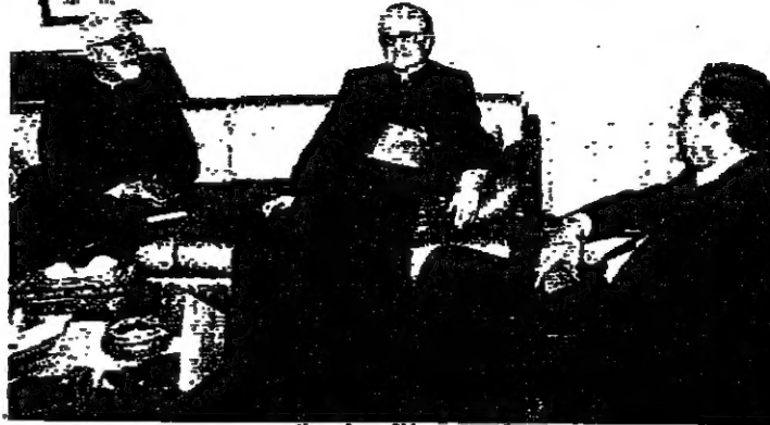
بزي مع بوانتي وافي نادر